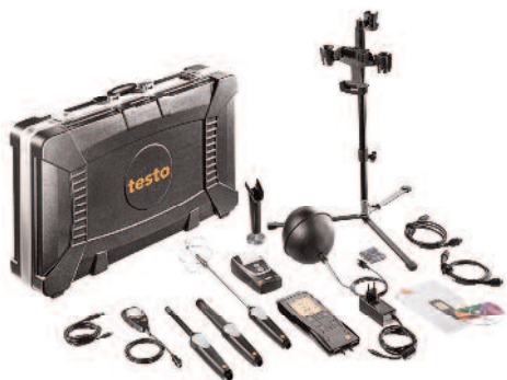
Maleta para medição de nível de conforto