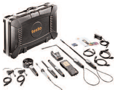
Maleta para medição HVAC